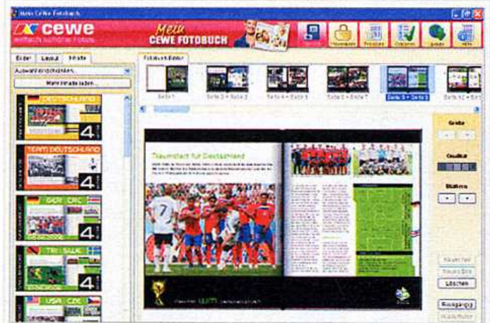
WELTMEISTERLICH CeWe bietet viele Zusatz-Features wie etwa Spielberichte und Team-Porträts zur WM, mit denen allein sich schon ein Fotobuch anlegen ließe.