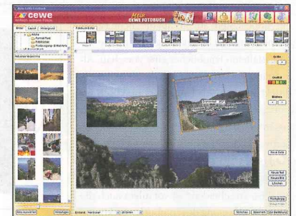
Bei dem Programm von CEWE lassen sich Bilder problemlos als Hintergrund verwenden.

Doch trotz des zunächst hoch wirkenden Preises sollten die Hobbyfotografen beachten, dass solch ein Bilderbuch recht viele Fotos fasst – schließlich lassen sich gut drei bis vier Bilder auf eine DIN-A4-Seite unterbringen. Wie viele Bilder auf eine Seite passen und wie sie angeordnet werden können, wird durch die Funktionen der Software festgelegt. Und da gibt es gravierende Unterschiede. Wer etwa bei der Drogeriekette dm sein Fotobuch bestellt, kann sich auf das variationsfreudige Gestaltungsprogramm von CEWE freuen. Dieses lässt dem Anwender viel Spielraum, bietet allerdings auch viele Vorlagen, welche an die eigenen Bedürfnisse angepasst werden können. Weniger flexibel ist hingegen beispielsweise das Programm von PixelNet. Dort lassen sich Bilder nur mühsam